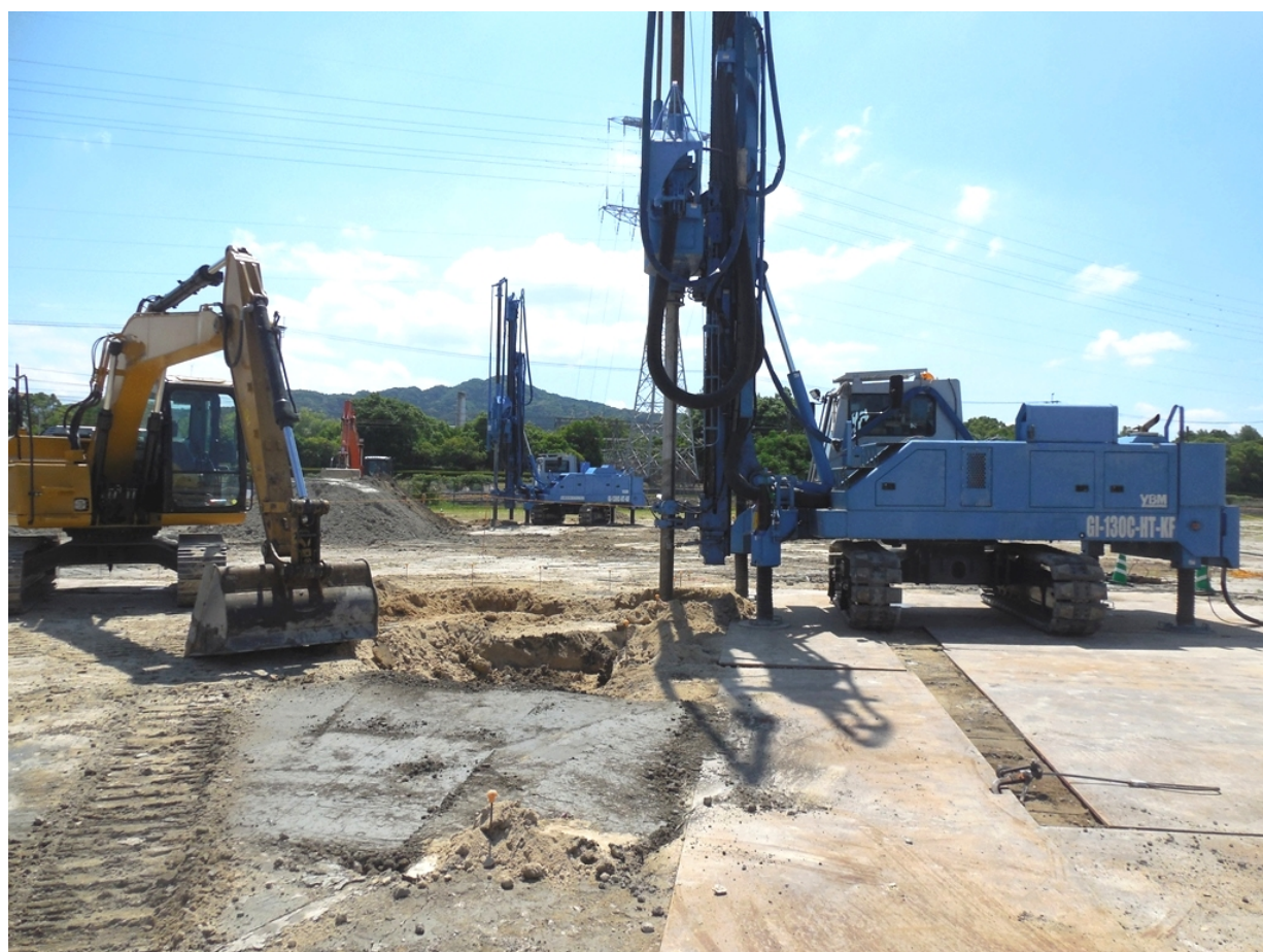
②地盤改良工事の状況