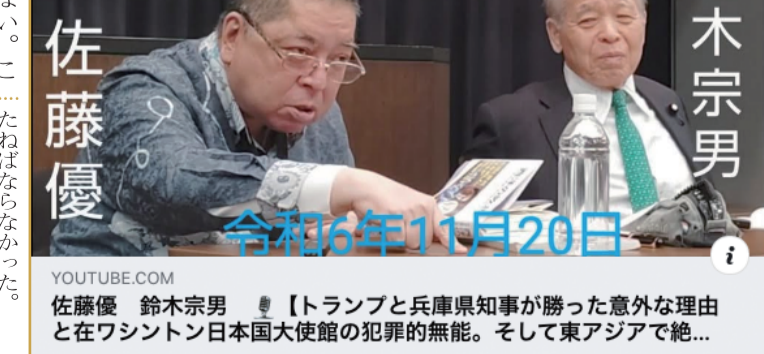
佐藤優 鈴木宗男 【トランプと兵庫知事が勝った意外な理由と在ワシントン日本大使館の犯罪的無能。そして東アジアで絶...

何もできていない。これから二十年。できると思いますか? 是非沖繩へ 鈴木 ● 我々に先生のお話を聞かせ頂けませんか? 鈴木 ● すぐにいきますよ。何時にしますか? 私は沖繩と関わりが深いのです。